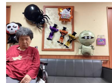
ハロウィン飾りを行い、一緒に写真を撮りました。