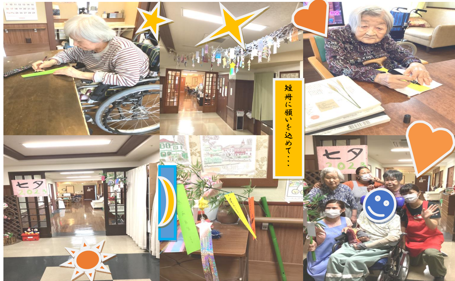
短冊に願いを込めて...

北之庄では、七月七日の七夕の日に合わせ、各階七夕の装飾のお手伝いや短冊に願いを書いていただきました。その際の様子をお伝えしていきます。 まず利用者様に、用意された短冊に願い事を書いて頂きました。「何を書こうかな?」と迷っておられた利用者様に、職員が「通勤電車で毎日座れますように」と書くこと「若いのに!」「もつと願いは大きく書かないと!」など笑いを誘う場面がありました。その後スイッチが入ったのか、「健康で穏やかにいたい」「万博に行きたいから、元気で過ごしたいな」など、様々な願いを真剣な面持ちで書いておられました。書くことが難しい方には、願いごとを確認し、職員が代筆しました。その後、笹の葉に短冊を結び、皆様で記念撮影を行いました。 今回利用者の皆様にも、各フロアの飾り付けのお手伝いをして頂きました。暑い日が続き、外出が難しい状況ではありますが、少しでも季節を感じていただけるような企画を考えていきます。皆様お楽しみに♪