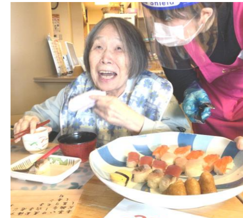
たくさんの寿司を前に、ご満悦です。

本部三階では、厨房主催のもと握り寿司フェアが行なわれました。普段とは違う食材が多く、利用者様に選んで召し上がって頂きました。「おいしいね。また食べたいわ」「いい企画やね。もつとして」と口々に仰り、大盛況な様子でした。