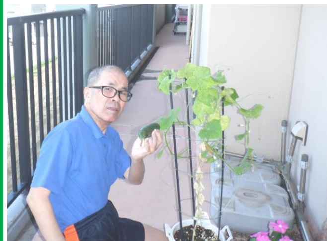
キュウリを収穫しました♪

北之庄三階ではベランダでキュウリを栽培しており、大きな実がなっていたので、日頃水やりなどの世話をされている入居者様に収穫して頂きました。 大きな実がなっているのを見て「こんな大きくなるんだね」と満足されている様子でした。 収穫したキュウリはサンドイッチの具にして召し上がられています。 今後も色々な野菜を植えて、育てていく楽しみを皆様と共有したいと思います。