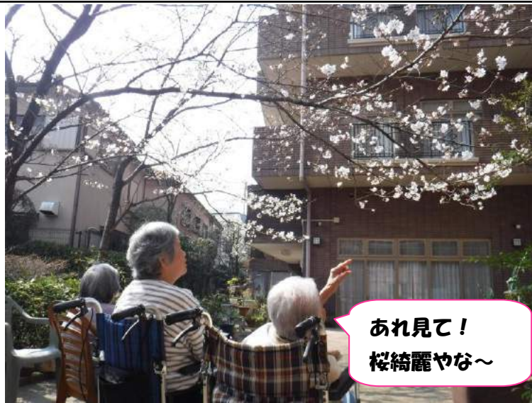
あれ見て！ 桜綺麗やな～

社会福祉法人テンダー会 特別養護老人ホーム らくらく苑 尼崎市田能4丁目2-50 TEL06-6494-1248 特別養護老人ホーム北之庄らくらく苑 尼崎市田能3丁目5-28 TEL06-6494-1250 http://www.rakurakuen.jp