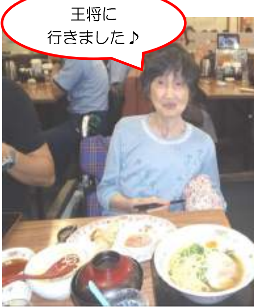
王将に 行きました♪